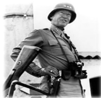
Obr. Americký generál Patton, když si prohlížel ruiny Škodovky, prohlásil: »Dobrá práce, jsem spokojený!«